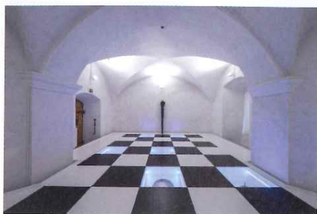
Sion: Fétiches

Vraies-fausses histoires. Le musée comme lieu d'interprétation est présenté par le Réseau Musées Valais qui retrace les pérégrinations de cinq collectionneurs imaginaires nés dans les Alpes valaisannes, à travers leurs collections d'objets historiques, ethnologiques et artistiques. Mises en scène dans cinq musées par les artistes Øystein Aasan et Paolo Chiasera et le curateur Benoît Antille, ces collections inventées immergent le spectateur dans l'univers de personnages hauts en couleur ayant vécu entre le XVII e siècle et aujourd'hui.