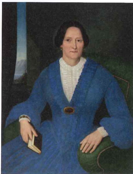
Sion: Femme aux boucles d'oreilles

la figure de l'«idiot» qu'on retrouve dans le roman Bouvard et Pécuchet (1881) de Flaubert. La référence à la Mule et au Musée d'Isérables servent de prétexte aux deux thématiques principales de l'inventeur-amateur: la curiosité et la métamorphose.